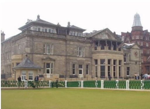
The Royal and Ancient Golf Club of St Andrews