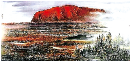
■孫明才國畫《妖嬈孤山頭》

音樂背景，讓人輕鬆愉悅的 觀賞，何樂而不為？其點擊 率可以一目了然，且可永久 保存，這是高科技引領我們 的書畫家開拓現代化的畫展 新途徑。 (2018年2月16日於悉尼 無聲聲)