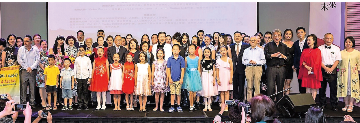
▲2018悉尼詩歌春晚嘉賓和朗誦演員合照

到了外邊，看到同學和 他手下的一幫工人正在 變壓器下邊搗鼓著，同 學跟我說：我也沒錢， 現在八項規定這麼嚴，我 只有這點特權！ 我激動得熱淚盈眶，不 管那個行業，還是同學 最靠譜！