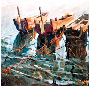
■龔除作品《三隻紅船》

然，此次微刊展覽是一種現 代化新型的畫展模式，有別 於在大庭廣眾的展覽觀摩。 雖看不到原作本身，然而節 省了人力財力，效果猶如動 態的幻燈片，可以反復觀 看，還可以通過微信無限的 傳播；若再配以悅耳動聽的